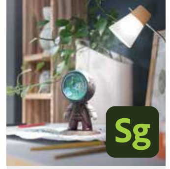
Adobe Substance 3D Sampler